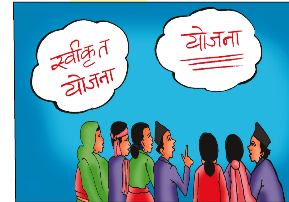
जिल्ला स्तरिय स्वीकृत योजना कार्यान्वयन प्रकृया प्रारम्भ - चैत्र १० गते भित्र