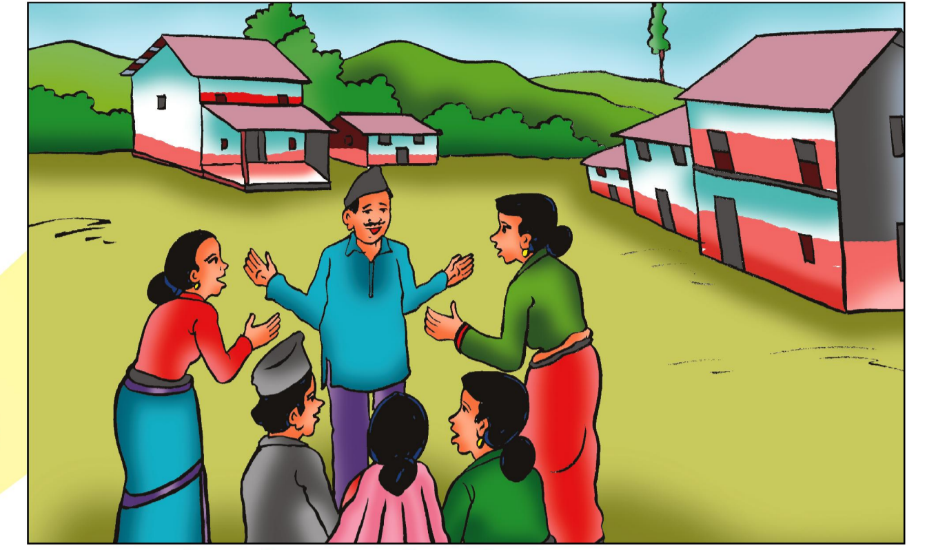
इलाका स्तरिय योजना तर्जुमा गोष्ठी - माघको तेस्रो हप्ता भित्र