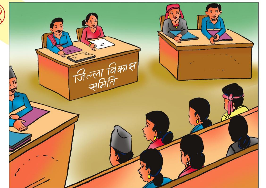
जिल्ला विकास समिति बैठक - फागुन तेस्रो हप्ता भित्र

सुशासन र जवाफदेहिता आजको आवश्यकता, योजना निर्माणमा हाम्रो सहभागीता