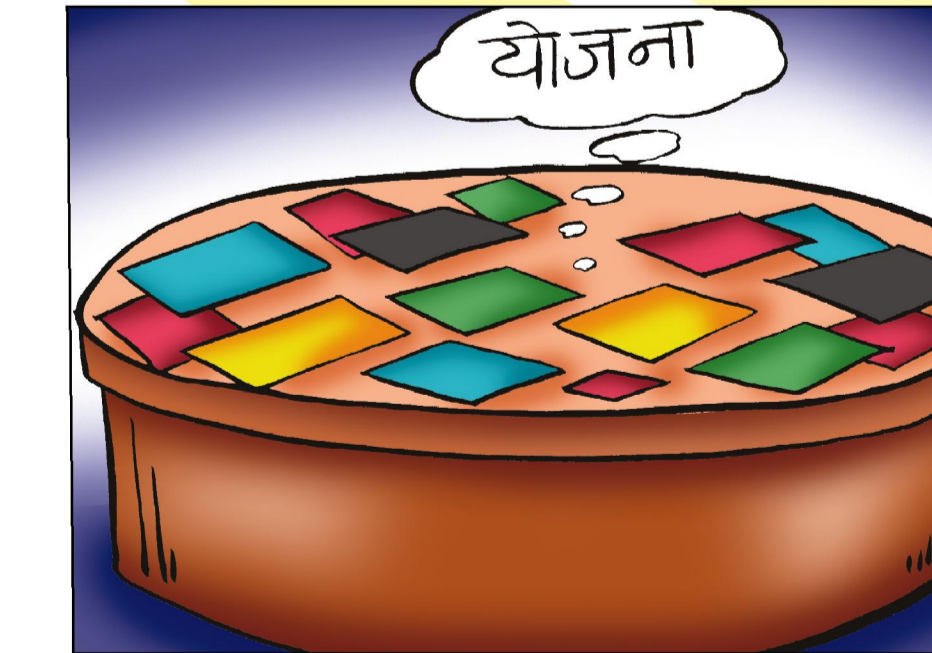
जिल्ला परिषद बैठक - फागुन मसान्त भित्र