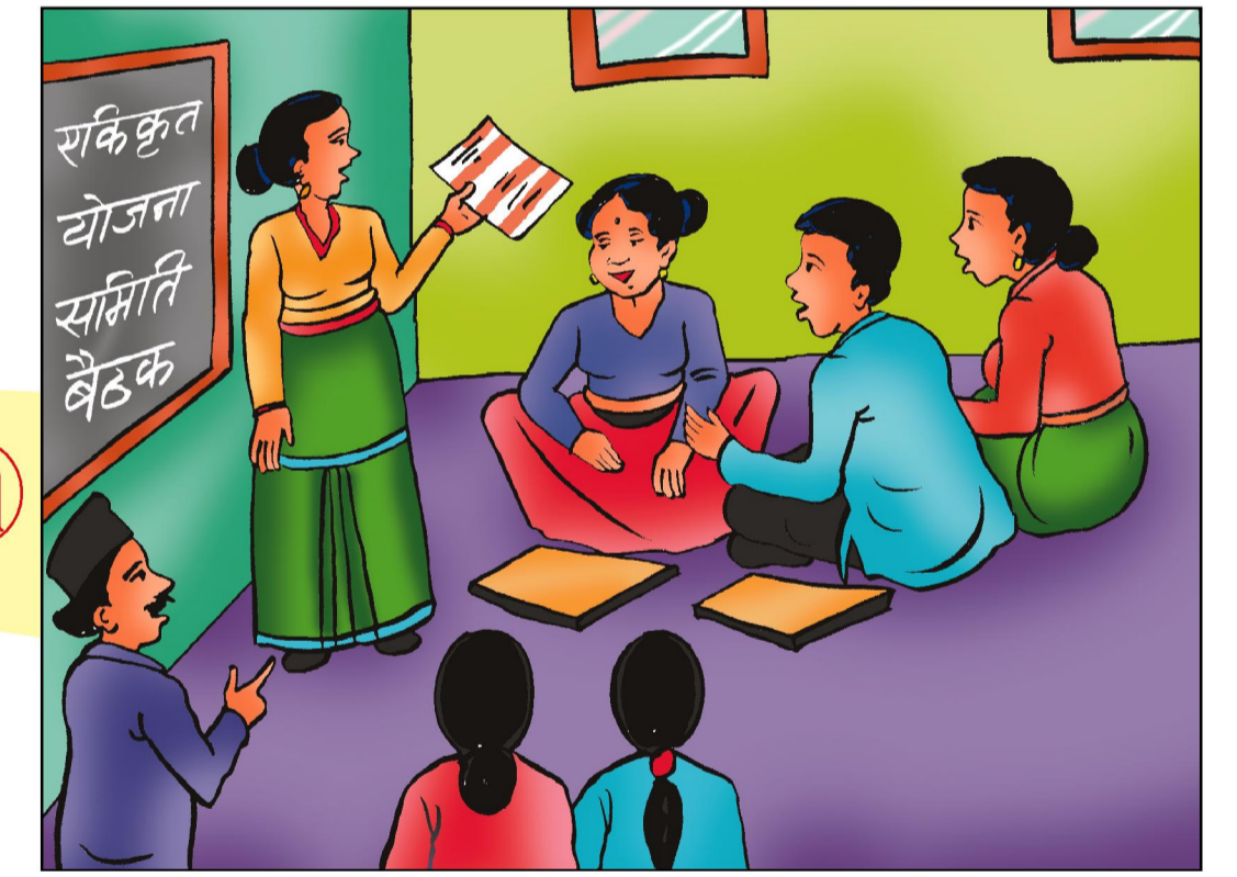
एकिकृत योजना समिति बैठक - फागुन दोस्रो हप्ता भित्र