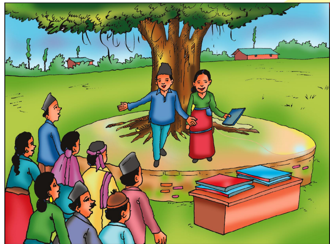
योजना तर्जुमा बैठक - मंसिर दोस्रो हप्ता