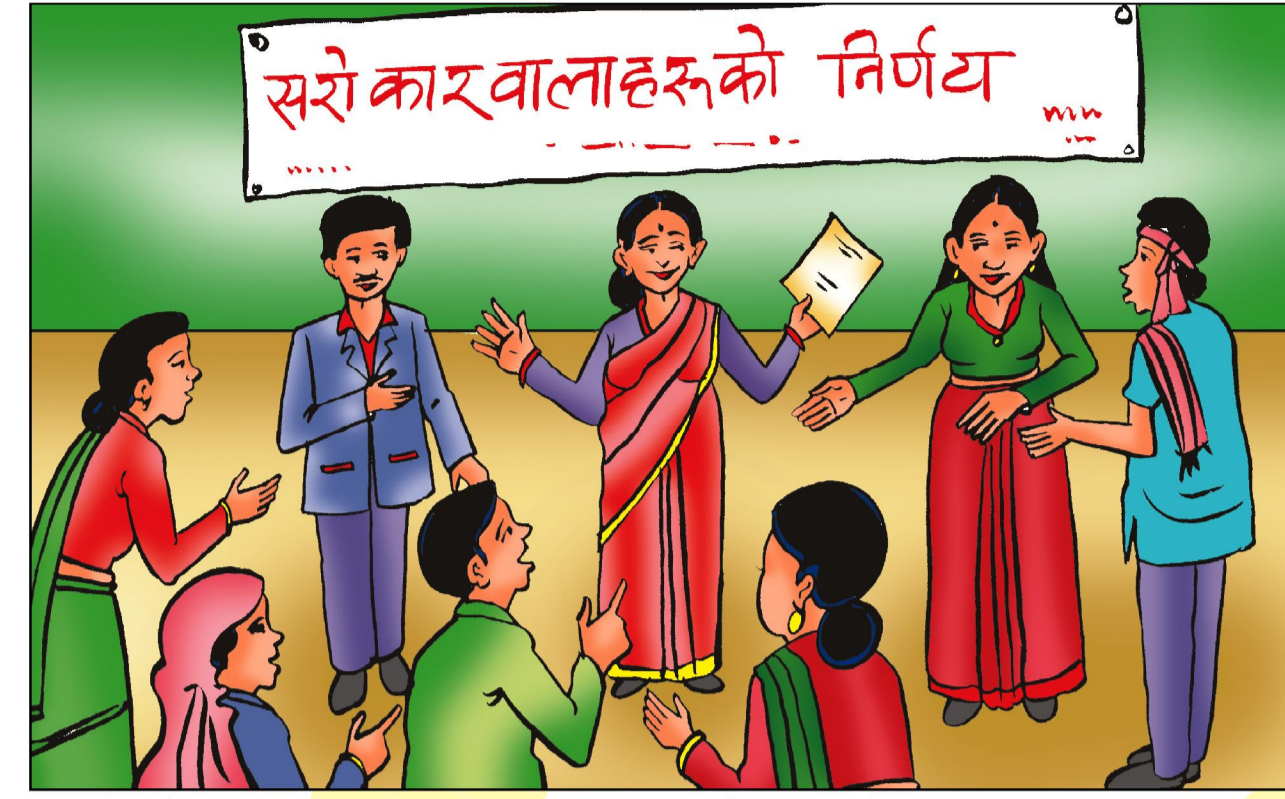
गा. वि. स./न. पा. परिषद बैठक - पौष मसान्त भित्र