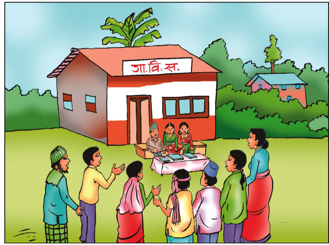
गा. वि.स./न. पा. - पौषको पहिलो हप्ता भित्र