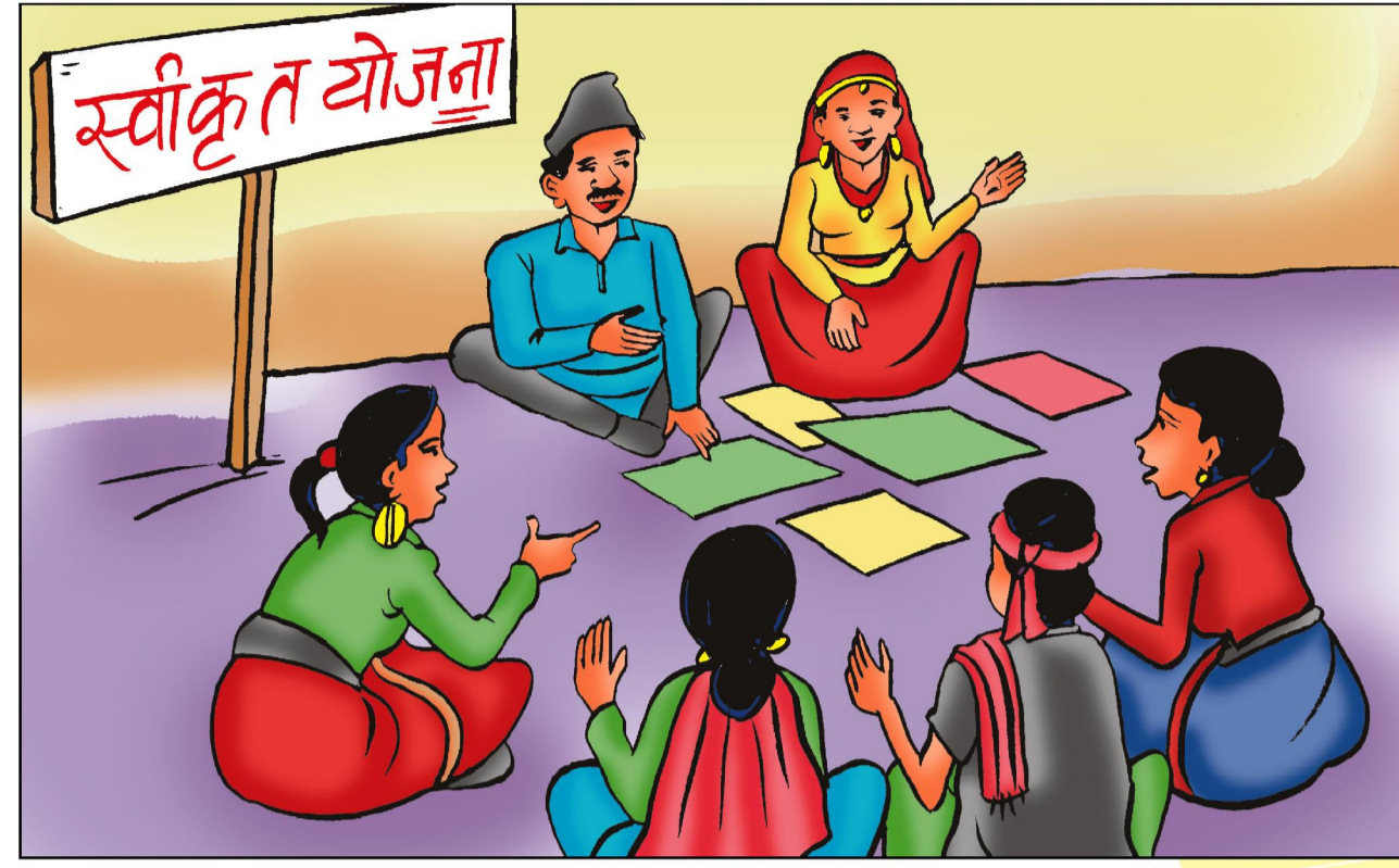
गा. वि. स./ न. पा. बैठक (एकिकृत योजना तर्जुमा समिति बैठक) - पौषको तेस्रो हप्ता भित्र