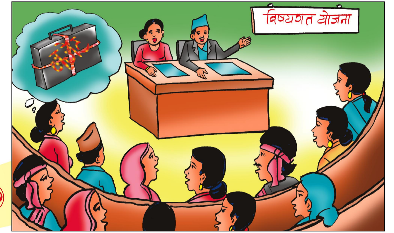
विषयगत योजना तर्जुमा समिति बैठक - फागुन पहिलो हप्ता भित्र