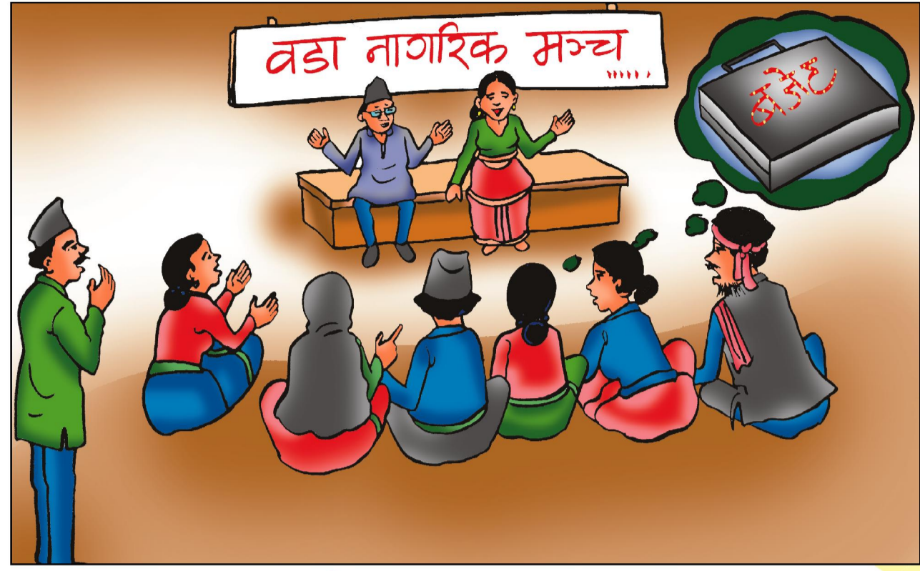
वडा समिति बैठक - पौषको दोस्रो हप्ता भित्र