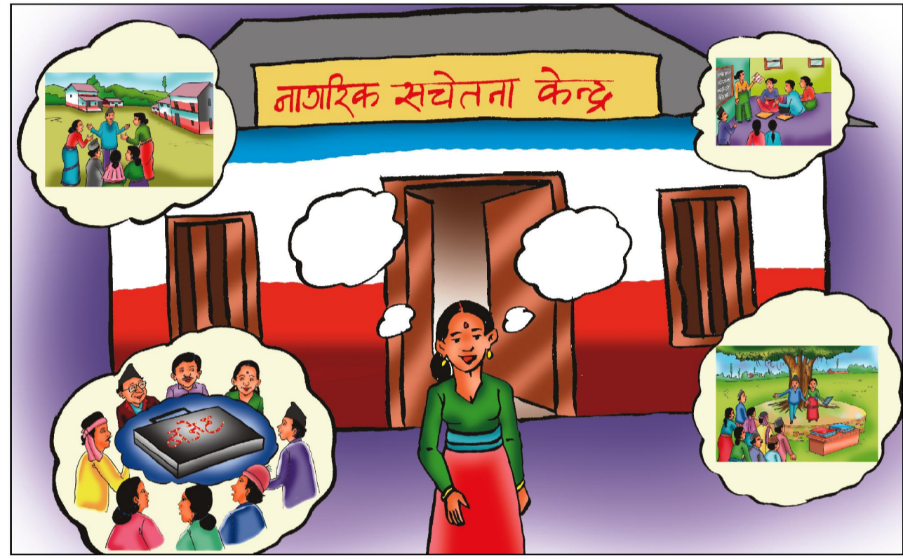
टोल बिस्तरको योजना छनौट - पौषको पहिलो हप्ता भित्र