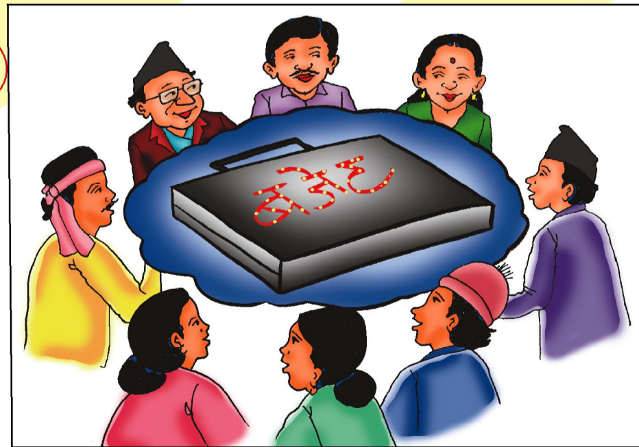
बजेट पूर्वानुमान र मार्गदर्शनको पूनरावलोकन मंसिर पहिलो हप्ता